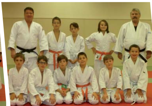
Groupe des benjamins