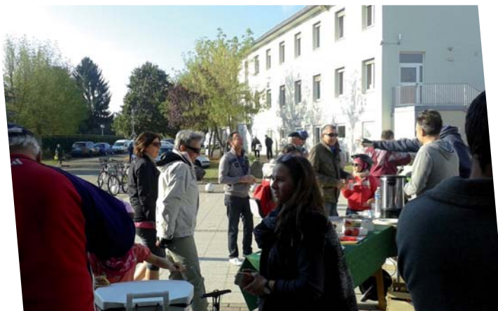
Vélo tour 2016

Alors rejoignez-nous pour découvrir notre club! https://sites.google.com/site/judojujitsu-duppigheim/