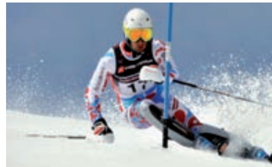
Championnat de France de slalom aux Arcs.